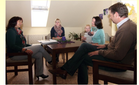
Eltern und Erzieherinnen